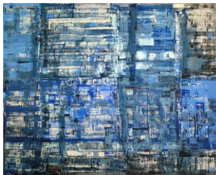
Maria Helena Vieira da Silva